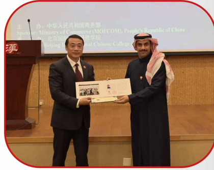
ندوة حول تطوير الصناعات الثقافية والإبداعية الرقمية للمسؤولين