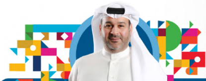
الشيخ حمد بن سلمان آل خليفة الوكيل المساعد للتجارة المحلية والخارجية

يمكن التحقق من مطابقة المنتجات للوائح الفنية من خلال برامج الاختبار أو إصدار الشهادات، والتي توفر ضماناً لموثوقية المنتج وسلامته وجودته.