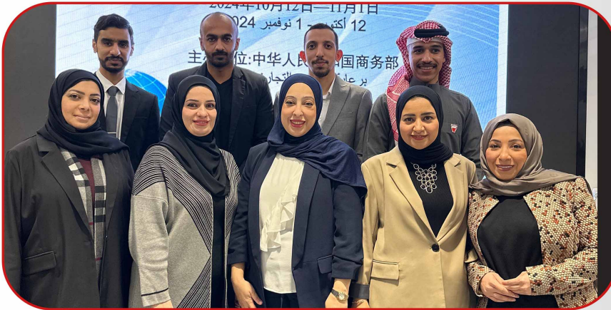
الدورة التدريبية لموظفي الإدارة العامة في الدول العربية