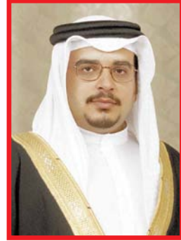
صاحب السمو الشيخ سلمان بن حمد آل خليفة ولي العهد القائد العام لقوة الدفاع