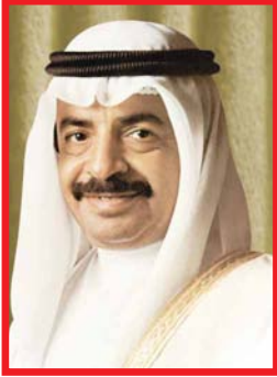
صاحب السمو الشيخ خليفة بن سلمان آل خليفة رئيس مجلس الوزراء