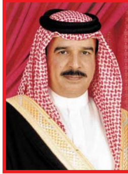
حضرة صاحب الجلالة الملك حمد بن عيسى آل خليفة ملك مملكة البحرين