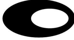
متحف المستقبل MUSEUM OF THE FUTURE